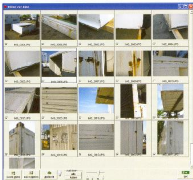
Bild 1. In der Gesamtübersicht wird durch Verschieben der Bilder mit der Maus die Reihenfolge festgelegt

In einer Gesamtübersicht wird durch Verschieben der Bilder mit der Maus die Reihenfolge festgelegt. Mit nur einem Mausklick wird das Bild gekippt. Neben der Beschriftung der Bilder besteht die Möglichkeit, Symbole, Pfeile und Nummern per „Drag & Drop“ über das Bild zu legen. Besonders wichtig ist, dass die Symbole jederzeit wieder entfernt werden können – das Originalbild bleibt, ohne zusätzlichen Aufwand an Festplattenkapazität, erhalten. So lassen sich Details in der Fotodokumentation besser darstellen als auf dem herkömmlichen Weg und die Fotodokumentation wird eine wichtige Kommunikationshilfe.